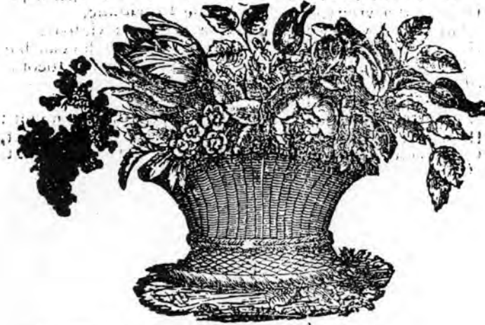
Illustration of a basket of flowers.

Faint, illegible text, likely bleed-through from the reverse side of the page.